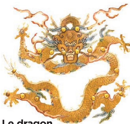
b- Le dragon