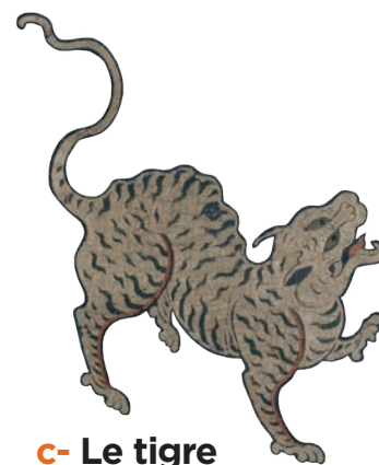
c- Le tigre

À l'origine, les mandarins étaient des hauts fonctionnaires travaillant pour l'empereur de Chine. Ils devaient passer de nombreux concours pour accéder aux charges civiles et militaires. Très influencé par sa voisine la Chine, l'empire d'Annam a repris ce type d'administration.