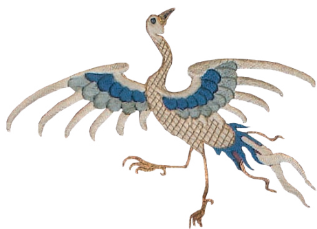
a- La grue

Entoure ci-dessous l'animal qui la décore.