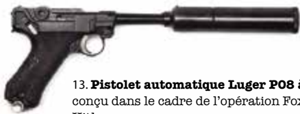
13. Pistolet automatique Luger P08 à silencieux, de calibre 9 mm, conçu dans le cadre de l'opération Foxley, destinée à assassiner Adolf Hitler Seconde Guerre mondiale MALDON, COMBINED MILITARY SERVICES MUSEUM