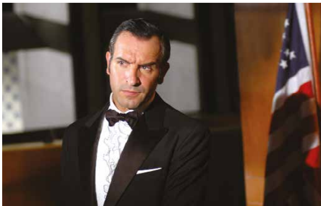
32. Jean Dujardin dans le film OSS 117, Rio ne répond plus ,

Programmation complète et détaillée sur musee-armee.fr