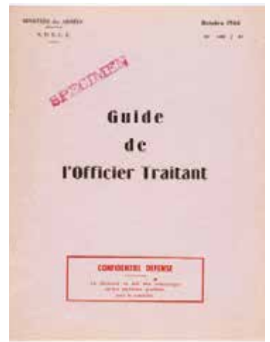
11. Guide de l'officier traitant édité en 1966 pour la formation des officiers traitants du SDECE, il fournit les éléments de formation nécessaires aux futurs officiers traitants chargés, dans le cadre de la recherche du renseignement d'origine humaine, de recruter et de manipuler les sources, afin d'en obtenir le meilleur renseignement possible. Octobre 1966 DGSE – Ministère de la Défense