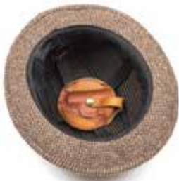
16. Chapeau en tweed équipé d'un étui de pistolet MALDON, COMBINED MILITARY SERVICES MUSEUM Guerre froide, 1958