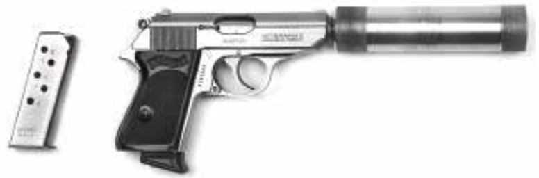
21. Pistolet automatique Walther PPK/S de calibre 9 mm dont le numéro de série commence par A 007 en référence à James Bond Guerre froide Maldon Combined Military Services Museum, U.K