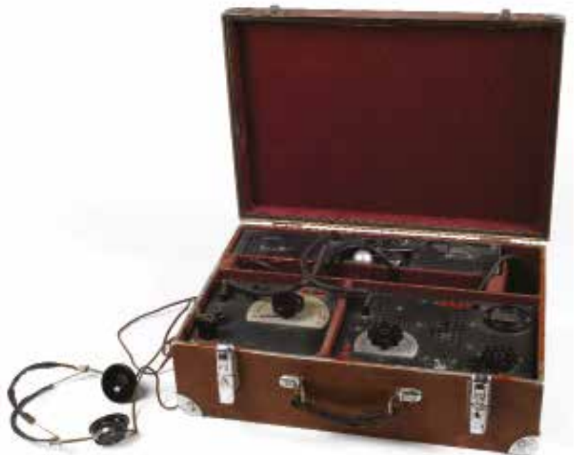
22. Émetteur-récepteur type SE 90/40, utilisé pour la mission Carthage Le 16 octobre 1943, l'Abwehr (service de renseignement allemand) affrète un Focke-Wulf FW 200 Condor qui part de Bordeaux-Mérignac et parachute au Maroc des agents français recrutés pour mener des actions de sabotage en Afrique du Nord. Repérés avant leur départ par un officier du contre-espionnage clandestin français, ils sont arrêtés dès leur arrivée. Jusqu'en mars 1944, l'opérateur radio transmet sous contrôle un savant mélange de vrais et faux renseignements à l'Abwehr. Seconde Guerre mondiale DON DU SERVICE DE DOCUMENTATION EXTÉRIEURE ET DE CONTRE-ESPIONNAGE (SDECE)