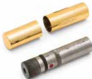
17. Rouge à lèvres «Baiser de la mort» dissimulant un pistolet intégré à un coup de calibre 6 mm, de fabrication britannique. Acier, or, argent Guerre froide, vers 1960 MALDON, COMBINED MILITARY SERVICES MUSEUM