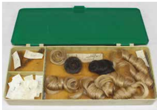
4. Postiches et matériel de « désilhouettage » utilisés par la Stasi : perruque, fausses moustaches, moule en plâtre pour la fabrication d'un faux nez et maquillage. Guerre froide.

Pour la fiction, EON Productions (Londres), producteur historique de James Bond , le musée Gaumont (Neuilly-sur-Seine), producteur des OSS 117 de Michel Hazanavicius et Mandarin Productions, producteur de la série