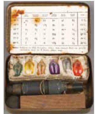
23. AC Delay Mk 1 SOE livré dans sa boîte avec des ampoules d'acétone et son allumeur chimique à retard Seconde Guerre mondiale MUSÉE DU DÉMINAGE - ASSOCIATION DES DÉMINEURS DE FRANCE

sur leurs arrières, afin de renverser le rapport de force, là où va s'engager l'effort principal. Dans le second cas, elles agissent dans l'illégalité pour contrer les positions d'un pays hostile, sans que les gouvernements à la manœuvre soient identifiés. Dans les deux cas, ces actions sont le fait d'hommes et de femmes spécialement formés et entraînés à des savoir-faire spécifiques et complexes, liés au monde de la clandestinité, indispensables au secret de l'opération et à la sécurité des agents. Seuls les services secrets sont habilités à mener de telles opérations et en mesure de le faire. Ils interviennent auprès des mouvements de guérilla ou de résistance en apportant un soutien militaire et une assistance technique. Par ailleurs, ils procèdent, souvent par l'intermédiaire de tiers, à des actions de sabotage d'installations civiles ou militaires, ainsi qu'à l'élimination physique de dirigeants ou de leaders d'opinion.