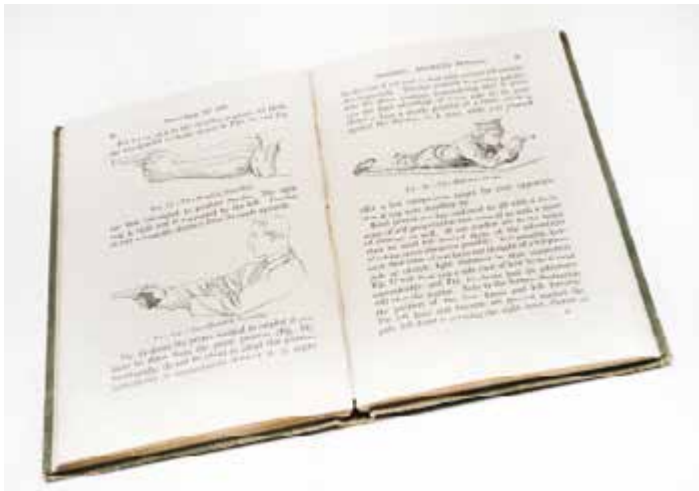
10. Get Tough! How to Win in Hand-to-Hand Fighting , manuel écrit par le capitaine W.E. Fairbairn, père du combat moderne au corps à corps, enseigné aux commandos britanniques et aux agents Sussex à l'école de Praewood House pr.s de St Albans Seconde Guerre mondiale, 1942 LA WANTZENAU, MM PARK – COLLECTION SUSSEX © D. Soulier Collection Sussex - MM Park