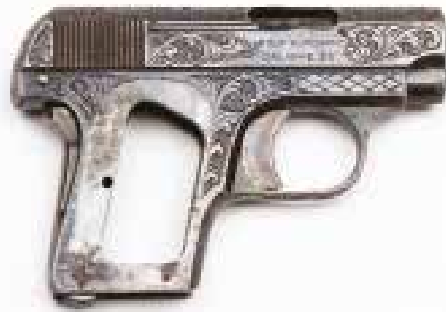
3. Pistolet automatique Colt modèle 1908 Baby, de calibre 6,35 mm

MALDON, COMBINED MILITARY SERVICES MUSEUM