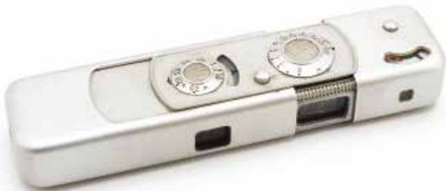
15. Appareil photo Minox, produit en Allemagne après la guerre, devenu avec l'usage l'appareil photo «espion» le plus populaire. Guerre froide, 1974