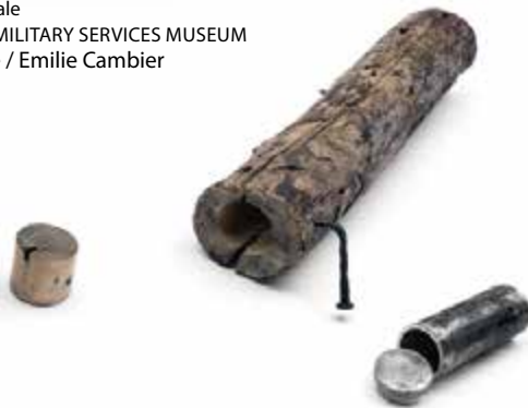
14. Boîte aux lettres morte sous forme de branche de branche Guerre froide MALDON, COMBINED MILITARY SERVICES MUSEUM