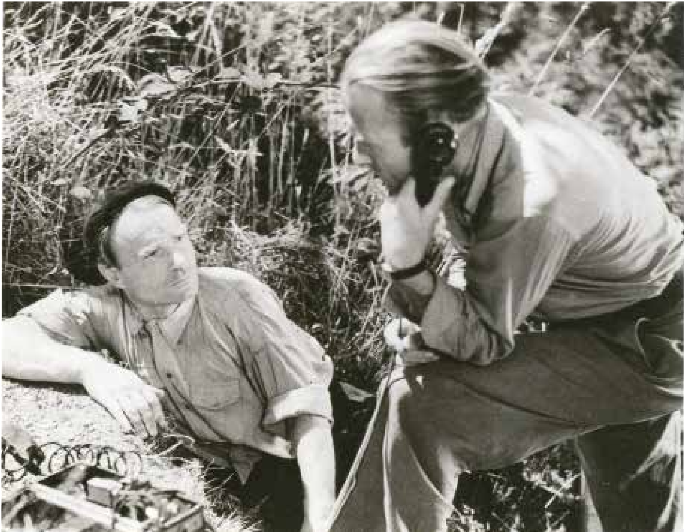
33. La Bataille du rail René Clément (1946)