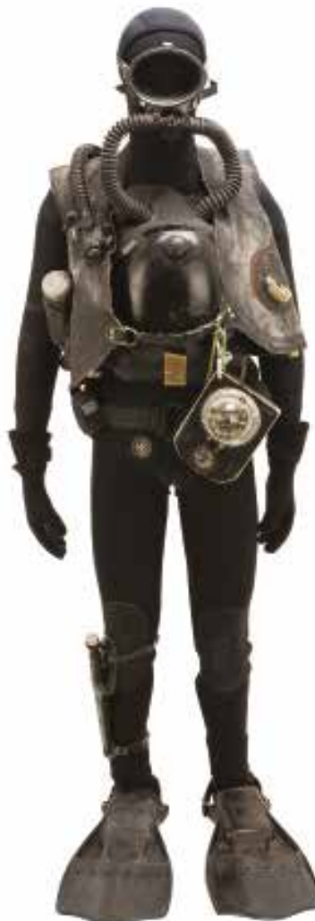
24. Tenue complète de plongée équipée de bouteilles d'oxygène à récupération de CO2, du Service Action du SDECE

Lorsqu'ils quittent la base navale d'Arzew en Algérie en 1953, les nageurs de combat du Service Action du SDECE s'installent à Toulon puis à Collioure, avant de rejoindre en 1960 la base d'Aspretto près d'Ajaccio, où est créé le Centre d'instruction des nageurs de combat (CINC). Pendant plus de vingt ans, ils mènent des opérations de reconnaissance de ports et d'installations militaires de pays hostiles et participent à des opérations clandestines dans le monde entier. Après l'échec de l'opération du Rainbow Warrior, le CINC quitte la Corse et s'installe en Bretagne. Guerre froide DGSE - MINISTÈRE DE LA DÉFENSE