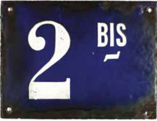
6. Plaque de rue du «2 bis» de l'avenue de Tourville, locaux du P.C. des Services de renseignement de 1932 à 1940 MUSÉE DE L'ARMÉE © musée de l'Armée Émilie Cambier

Il est impossible d'évoquer les guerres secrètes sans parler du lien entre l'État et les services de renseignement. Exceptionnellement pour l'exposition, des hommes politiques et d'anciens membres des services ont accepté de répondre aux demandes d'interviews du commissariat. Trois anciens Premiers ministres, Michel Rocard (1988 - 1991), Édouard Balladur (1993 - 1995) et Jean-Pierre Raffarin (2002 - 2005), et un ministre, Pierre Joxe (ministre de l'Intérieur de 1988 à 1991 et ministre de la Défense de 1991 à 1993), ont répondu à des questions communes ou particulières, par exemple sur les rapports qu'un Premier ministre entretient avec ses services secrets ou encore sur la place des services secrets et des guerres secrètes dans une démocratie. Outre ces anciens acteurs gouvernementaux, d'anciens membres des services secrets ont bien voulu répondre aux questions du commissariat, parmi eux le préfet Rémy Pautrat, directeur de la Direction de la surveillance du territoire (DST) de 1985 à 1986 et conseiller à la sécurité du Premier ministre Michel Rocard de 1988 à 1991, ainsi que le général de corps d'Armée (CR) Jean Heinrich, chef du Service action de la Direction générale de la Sécurité extérieure (DGSE) de 1987 à 1992 et directeur de la Direction du renseignement militaire (DRM) de 1992 à 1995.