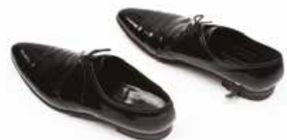
18. Chaussures de soirée de la célèbre marque américaine Florsheim, dont le talon dissimule une lame rétractable Guerre froide, 1965 Maldon, Combined Military Services Museum, © musée de l'Armée / Pascal Segrette