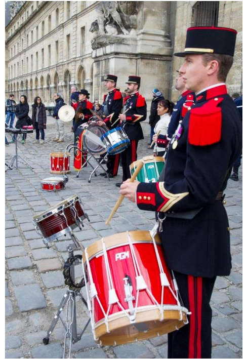
La fanfare de l'Ecole d'Artillerie aux Invalides

En l'an 235, Barbe, une belle et noble jeune fille de Nicomédie, dans l'actuelle Turquie, aurait été enfermée dans une tour par son père, Dioscore, pour la soustraire aux sollicitations du monde. De retour d'un voyage, apprenant qu'elle s'est convertie au catholicisme, il la livre au Gouverneur. Ce dernier la fait supplicier et décapiter par son propre père, qui est aussitôt frappé par la foudre et réduit en cendres. Au fil des âges, la tour finit par se confondre avec une poudrière, et Barbe, devenue sainte, est élue patronne des artificiers, des armuriers, des artilleurs, des mineurs et des sapeurs-pompiers. Elle est invoquée pour conjurer le tonnerre et les éclairs, ainsi que pour les accidents liés à l'explosion de la poudre à canon. Elle est fêtée chaque année le 4 décembre.