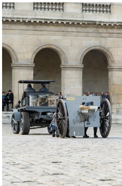
Démonstration d'artillerie de la Grande Guerre dans la cour d'honneur des Invalides