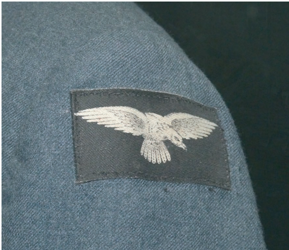
Aigle de la Royal Air Force

L'uniforme, présenté ici, date de 1943. Il se compose d'une veste à plusieurs poches, les unes plissées au niveau de la poitrine, les autres de grande taille situées au niveau des hanches, ainsi que d'une jupe arrivant aux genoux dans un tissu, le barathea 1 , en général de qualité supérieure à la serge 2 grossière de l'uniforme masculin de service. Sur la manche gauche de la veste se trouve le symbole de la RAF : l'aigle, tête baissée, aux ailes déployées. La tenue est complétée par une paire de chaussures à lacets en cuir noir alvéolé.