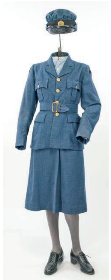
1 Auxiliaire féminine de la Royal Air Force (WAAF), 1943

L'uniforme de service des auxiliaires de la RAF ( Royal Air Force ), adopté à partir de mars 1939, est inspiré tant de l'uniforme d'aviateur de la RAF que de l'uniforme de l'ATS ( Auxiliary Territorial Service ). Seule la lettre A sur le devant ou sur la manche marque le statut d'auxiliaire. Cet uniforme a peu varié pendant les années de guerre.