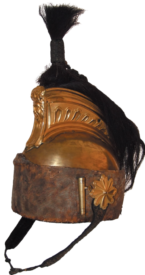
Casque de dragon. Inv : 4131.

Le modèle d'officier ressemble à celui de la troupe mais ses éléments métalliques sont dorés et ses décors plus soignés. Ce casque, d'une très grande qualité d'exécution, montre des ailerons estampés de palmettes sur fond sablé. Le masque est décoré dans sa partie supérieure de la tête de Méduse et au pied d'une palme. Des fleurs stylisées ornent les rosaces de laiton fixées de chaque côté du bandeau de cuir. Les rosaces maintiennent les jugulaires, ici en velours noir brodé de fils d'or et de canetille qui simulent des petites écailles. Les jugulaires sont fermées par une bride en cordonnet et un bouton en passementerie d'or.