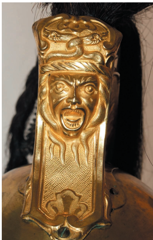
Méduse orne le masque du casque de dragon

Les dragons sont destinés aux missions de harcèlement, à l'ouverture des chemins, à la couverture des troupes en marche, à l'escorte des convois. Lors des sièges, ils participent avec