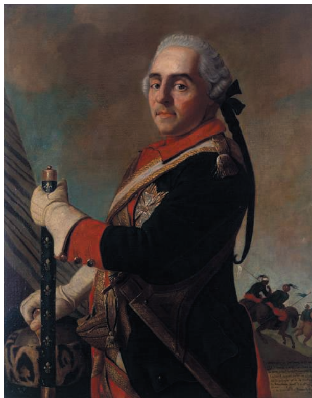
Portrait du maréchal Maurice de Saxe (1696-1750) par Jean-Étienne Liotard

formation de fantassin et de cavalier de ces soldats, crée l'état-major et la charge de colonel-général des dragons, qu'il remet au duc de Lauzun.