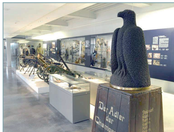
L'un des espaces première guerre mondiale du musée de l'Armée

Le parcours au musée de l'Armée se déroule au sein des collections permanentes consacrées à la première guerre mondiale (2 000 m 2 ). Il permet d'aborder la première guerre mondiale en générale mais aussi d'évoquer plus particulièrement la vie au front, la propagande vers l'arrière, etc.