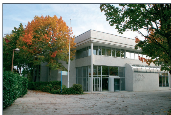
Entrée des archives départementales du Val-d'Oise

De 9h30 à 11h30 ou de 10h30 à 12h30 ; de 14h00 à 16h00 ou de 14h30 à 16h30