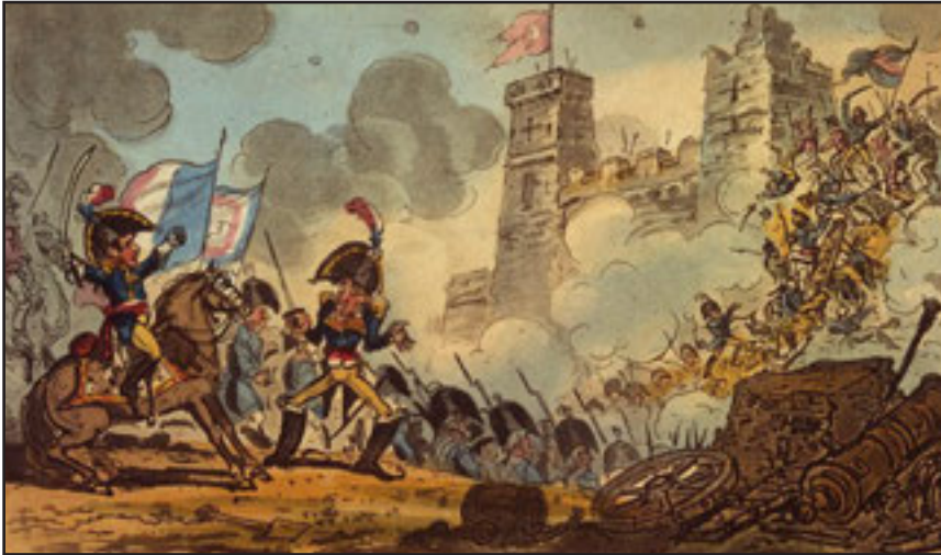
Siège d'Acre, caricature britannique © Paris, musée de l'Armée, Dist. RMN-GP.

Pourtant, le jeu uchronique napoléonien révèle rapidement une certaine limite : il dépeint avant tout Napoléon Bonaparte comme un en chef de guerre, par exemple en imaginant des victoires au tout