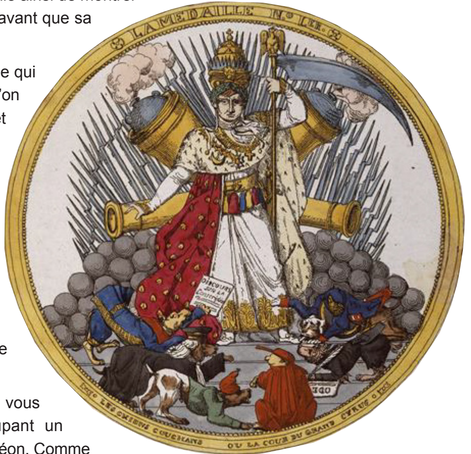
La Médaille N.° 1 er Les chiens couchans ou la cour du grand Cyrus, caricature créé vers 1806.