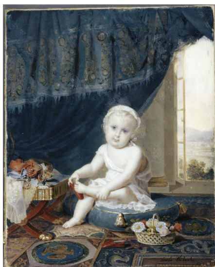
Thibault Aimée (1780 – 1868), Le roi de Rome essayant une pantoufle , vers 1812

Tarifs : 12 € / 7 € (moins de 18 ans) - réservation obligatoire