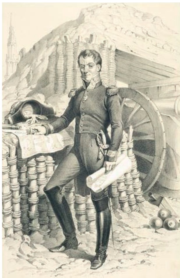
Lazare Carnot, officier du génie

Membre du Comité de salut public en juillet 1793, délégué aux Armées, il organise les levées en masse, dans le contexte des guerres révolutionnaires, crée les quinze armées de la République et pousse à la fabrication d'armes. Il prend même la tête des colonnes françaises, le 16 octobre 1793, alors qu'il n'est qu'inspecteur à l'armée du Nord, et contribue à la victoire décisive de Wattignies, près de Maubeuge, aux côtés du général Jourdan. Il est surnommé « l'organisateur de la victoire ».