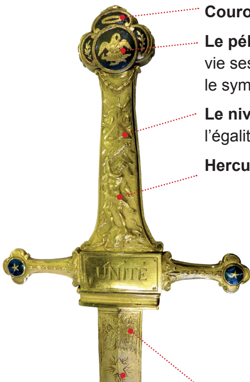
Avers du glaive

Couronne de laurier , symbole de victoire.