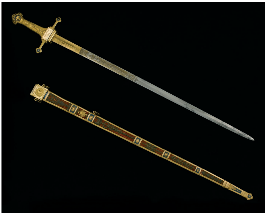
Fourreau et glaive de Carnot

Les objets présentés permettent d'évoquer un « soldat citoyen » qui a marqué la période de la Révolution française. Elle est complémentaire d'autres fiches-objets liées à Rouget de Lisle, Théophile Malot de la Tour d'Auvergne-Corret et Napoléon Bonaparte.