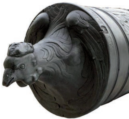
< 展示法国古典大炮， 荣军院贵宾庭