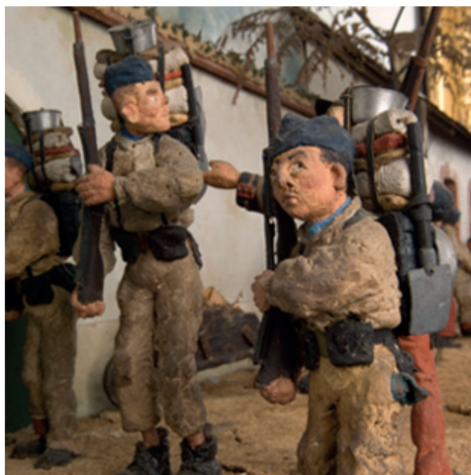
La vie de caserne