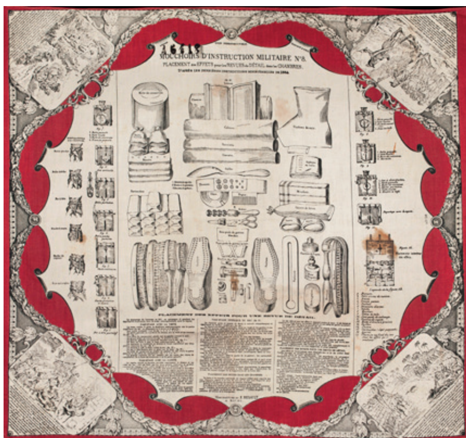
Mouchoir d'instruction n°8 : la revue de détail

Il s'agit pour le « bleu » d'apprendre à disposer les éléments de son paquetage de manière réglementaire, afin d'en faire constater le bon entretien. L'enjeu est surtout d'obtenir d'individus venus d'horizons très divers qu'ils se plient à des pratiques uniformes. Ces revues régulières sont redoutées car elles sont source d'innombrables punitions pour ceux qui, distraits ou pris par le temps, négligeaient certains détails. Elles constituent aussi l'occasion pour les anciens de monnayer leur aide et leurs conseils auprès des jeunes recrues, et sont en cela représentatives de la tradition orale de l'instruction militaire.