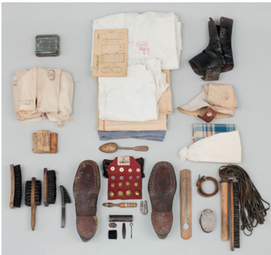
Revue de détail reconstituée