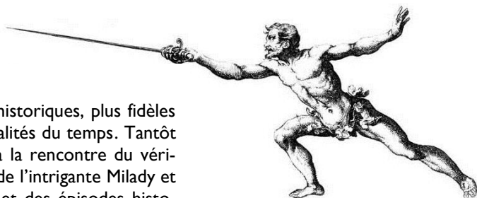
Esquimeur extrait du Grand traité de l'art de l'escrime, de Capo Ferro, 1610. Paris, musée de l'Armée.

A cet univers littéraire répondent des images historiques, plus fidèles à la vérité des mœurs, des faits et des personnalités du temps. Tantôt spectateur, tantôt archéologue, le visiteur va à la rencontre du véritable d'Artagnan, de Louis XIII et de Richelieu, de l'intrigante Milady et du masque de fer... Sans oublier des thèmes et des épisodes historiques comme l'escrime, le siège de La Rochelle ou la Fronde. Il découvre la reconstitution des ferrets de la reine, due au cristallier Lalique, se voit proposer une ballade virtuelle dans les rues de Paris à travers le temps avec le plan Dumartagnan , ou est plongé dans l'univers de ces soldats à l'aide de dioramas grandeur nature, comme celui des tranchées du siège de Maastricht, où d'Artagnan trouva la mort en 1673.