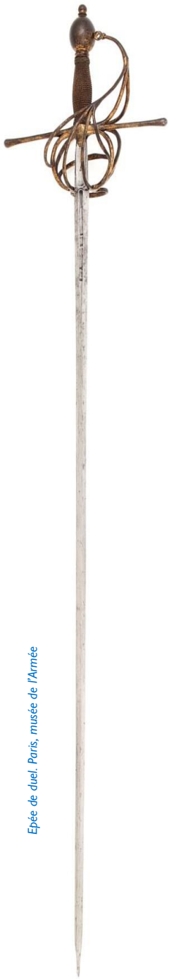
Epée de duel, Paris, musée de l'Armée