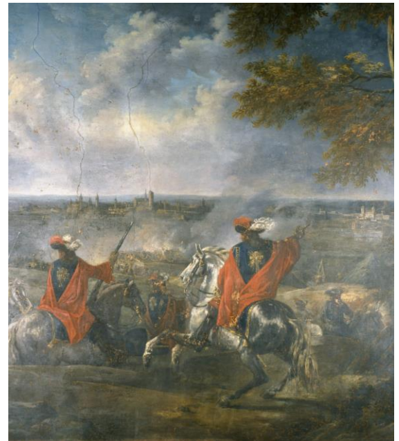
Peinture murale représentant la prise de Gand, par Joseph Parrocel. Paris, musée de l'Armée.