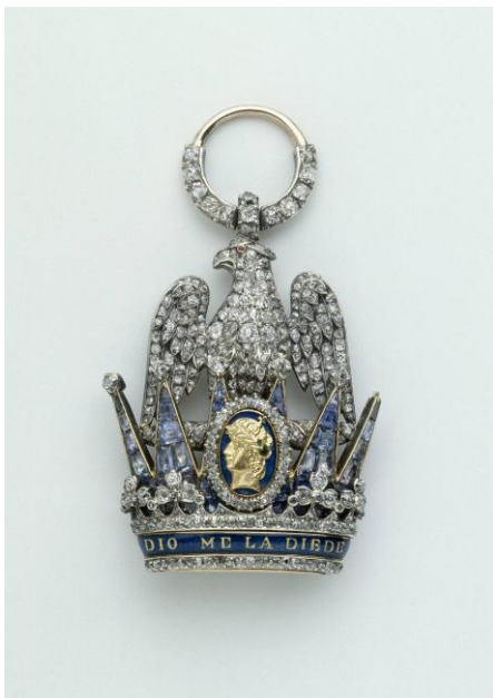
Insigne de dignitaire de l'ordre de la Couronne de Fer de Napoléon I er Collection du musée de l'Armée