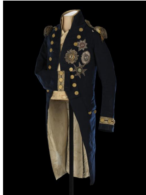
Habit de petit uniforme et épaulettes portés par lord Nelson à la bataille de Trafalgar Collection du National Maritime Museum

Une animation multimédia déroulera la célèbre bataille des « Trois Empereurs », à Austerlitz, accompagnée d'un commentaire audio faisant revivre les explications adressées par Napoléon au prince Louis de Bavière alors qu'il esquissait devant lui les mouvements des armées (cf. ci-dessus).