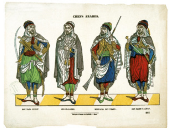
Chefs arabes 231, anonyme

Nord dont hérite la toute jeune Monarchie de Juillet : occupation restreinte ou totale ? Si les Français prennent vite possession de quelques points du littoral, l'intérieur du pays leur échappe totalement et l'armée se heurte à de fortes oppositions. A l'Est, le bey Ahmed tient vigoureusement le beylik de Constantine au nom de la Sublime Porte jusqu'en 1837, tandis qu'à partir de 1832, à l'Ouest, s'impose peu à peu la figure de la résistance aux Roumis (chrétiens), l'émir Abd el-Kader.