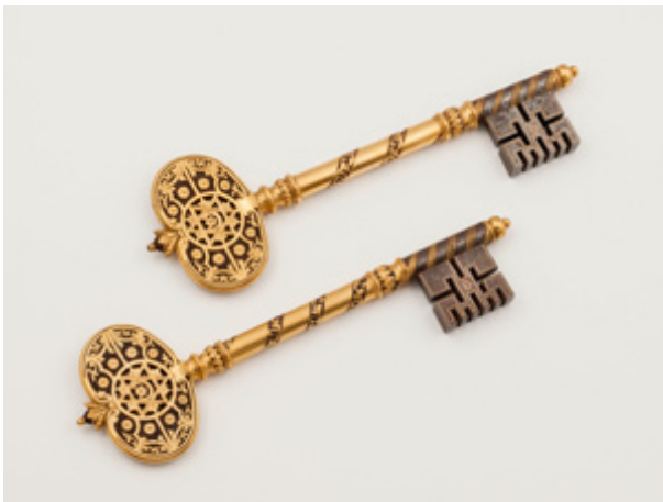
Clés d'honneur de la ville d'Alger

Lorsqu'en 1830 la flotte française débarque dans la presqu'île de Sidi-Ferruch, la Régence d'Alger, qui dépend depuis près de trois siècles de l'empire ottoman, possède toutes les caractéristiques d'un Etat souverain. Dirigée par une oligarchie militaire turque, elle contrôle Alger de près et l'arrière