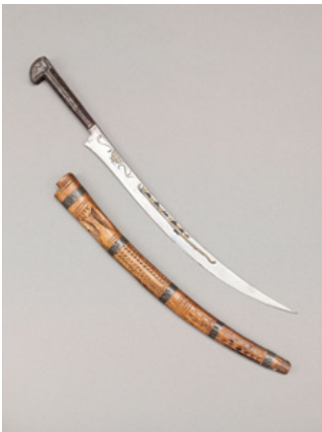
Poignard kabyle (flissah)

Aux lendemains de la soumission d'Abd el-Kader, l'éphémère deuxième République esquisse une politique d'assimilation et de colonisation. La constitution de 1848 déclare ainsi l'Algérie « territoire français » et l'organise en trois départements. La conquête n'est cependant pas terminée et les insurrections sont durement réprimées. A partir de 1852, le Second Empire conforte le rôle des militaires dans l'administration et relance la conquête. Le général Randon, nommé gouverneur de l'Algérie, soumet ainsi les oasis du nord du Sahara algérien et surtout, en 1857, la Kabylie, dernier bastion