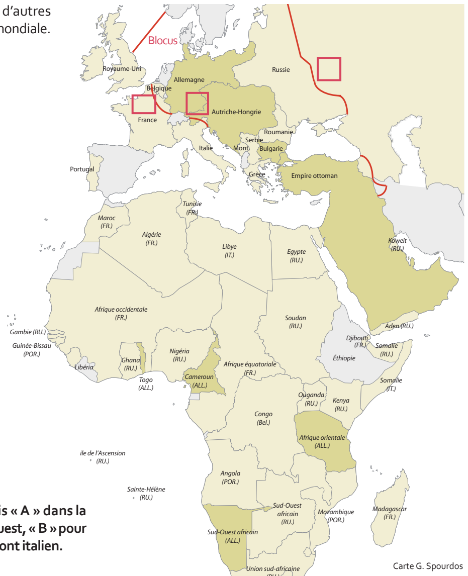
Carte G. Spourdos

À toi de jouer ! Sur la carte ci-contre inscris « A » dans la case qui correspond au front d'Europe de l'Ouest, « B » pour le front de l'Europe de l'Est et « C » pour le front italien.