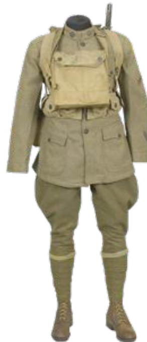
c- Uniforme du soldat américain (1917)