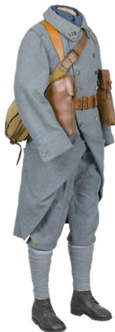
b- Uniforme du soldat français (1917)