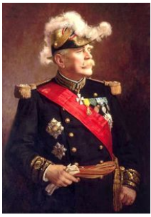
Le général Joffre

Dirige-toi au fond de la salle Joffre, tout près du portrait ci-contre, vers la carte animée de la première bataille de la Marne. Regarde-la pour mieux comprendre ce combat qui s'est déroulé en France, du 5 au 12 septembre 1914. Il a opposé l'armée allemande à l'armée française et au corps expéditionnaire britannique).