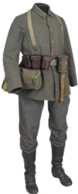
a- Uniforme du soldat allemand (1915)