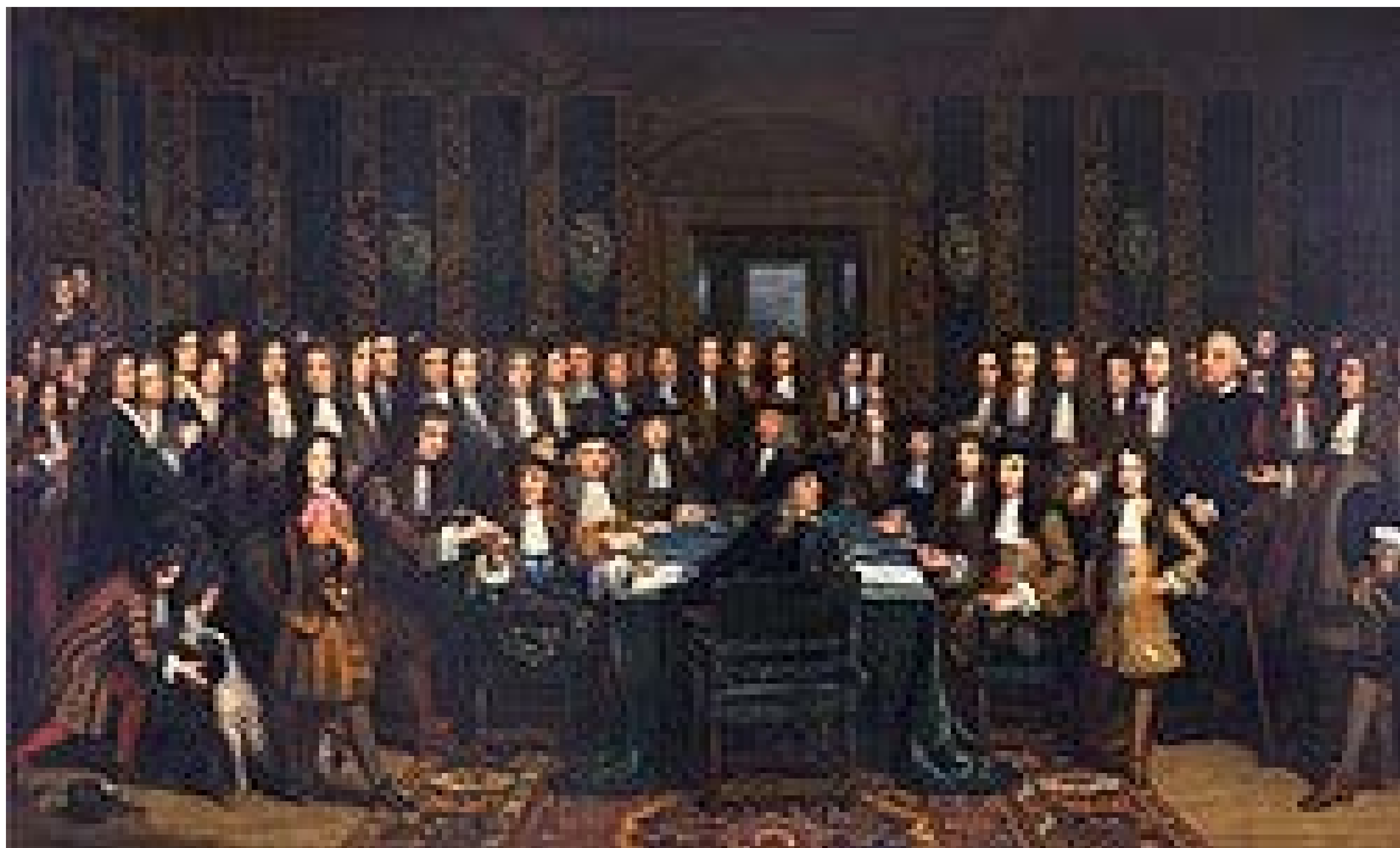
© Museum het Valkhof, Nijmegen - Henri Gascar, Paix de Nimègue - La signature du traité de paix entre les Royaumes de France et d'Espagne, (17 septembre 1678)

La ville, comme beaucoup d'autres dans la région, est démilitarisée et perd une partie de son importance stratégique.