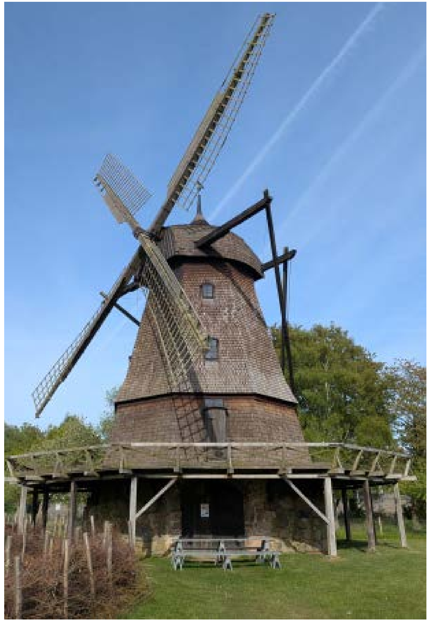
Moulin à galerie, Hollande