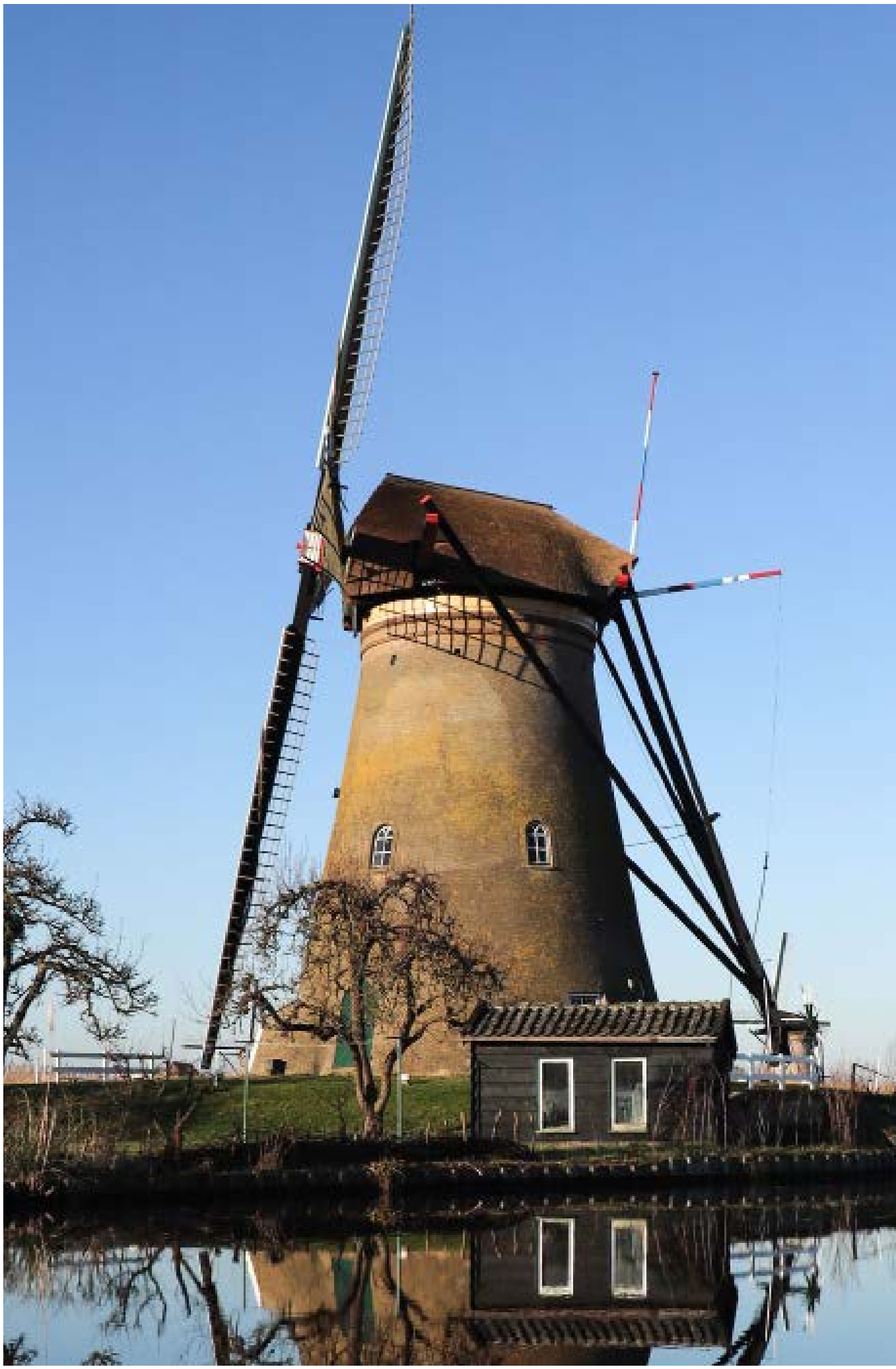
moulin-tour de Kinderdijk, Hollande