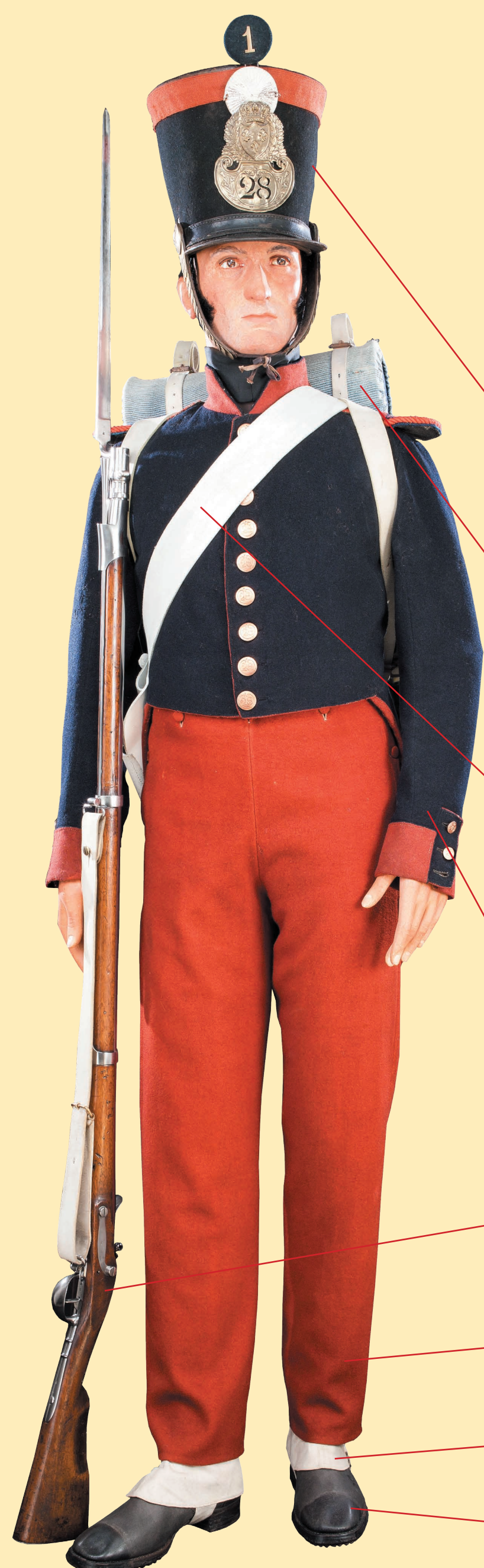
La fleur de lys *