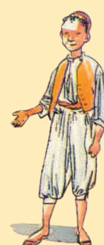
© Casterman, dessin J. Ferrandez / Musée de l'Armée / RMN

في ساعة Fissa est un mot arabe qui signifie « tout de suite, sur l'heure ».