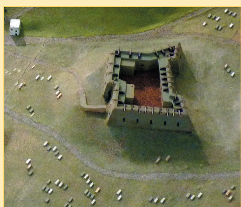
Le fort de l'Étoile

La ville d'Alger est protégée au sud et au nord par des batteries et des forts armés de canons répartis sur les côtes. Regarde bien la ville : elle est entourée de hauts murs d'enceinte. Malgré ces multiples constructions, la défense d'Alger est faible, surtout du côté de la terre. Le fort de l'Empereur, situé en haut d'Alger au-dessus de la casbah, c'est-à-dire la vieille ville, n'est pas visible sur le plan-relief mais il est proche du fort de l'Étoile que tu peux voir ci-contre. Retrouve-le sur le plan-relief.