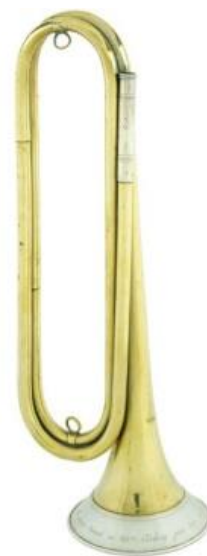
Trompette d'honneur décernée par le premier consul au citoyen Norberg

Avec le concours du CIC, grand partenaire du musée de l'Armée.