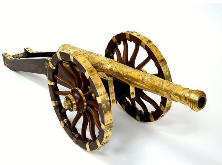
Modèle de canon sur affût offert par le parlement de Franche-Comté à Louis XIV

Même si la plupart de ces modèles sont aptes au tir, ce ne sont pas des armes. Jusqu'au début du XIX e siècle, ces objets réalisés dans des matériaux précieux sont très appréciés et collectionnés. A partir de la fin du XIX e siècle, l'aspect technique devient de plus en plus important : certains modèles représentent le seul témoignage de pièces d'artillerie aujourd'hui disparues.