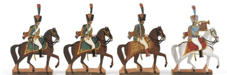
Régiment de chasseurs à cheval, Garde Impériale, 1804-1815

Elles permettront de retracer l'histoire de leurs principaux fabricants et collectionneurs, les différentes techniques de fabrication employées, ainsi que leur rôle dans la diffusion d'une image flatteuse de l'armée dans la société.