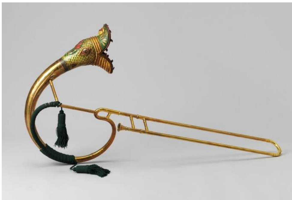
Buccin Forveille