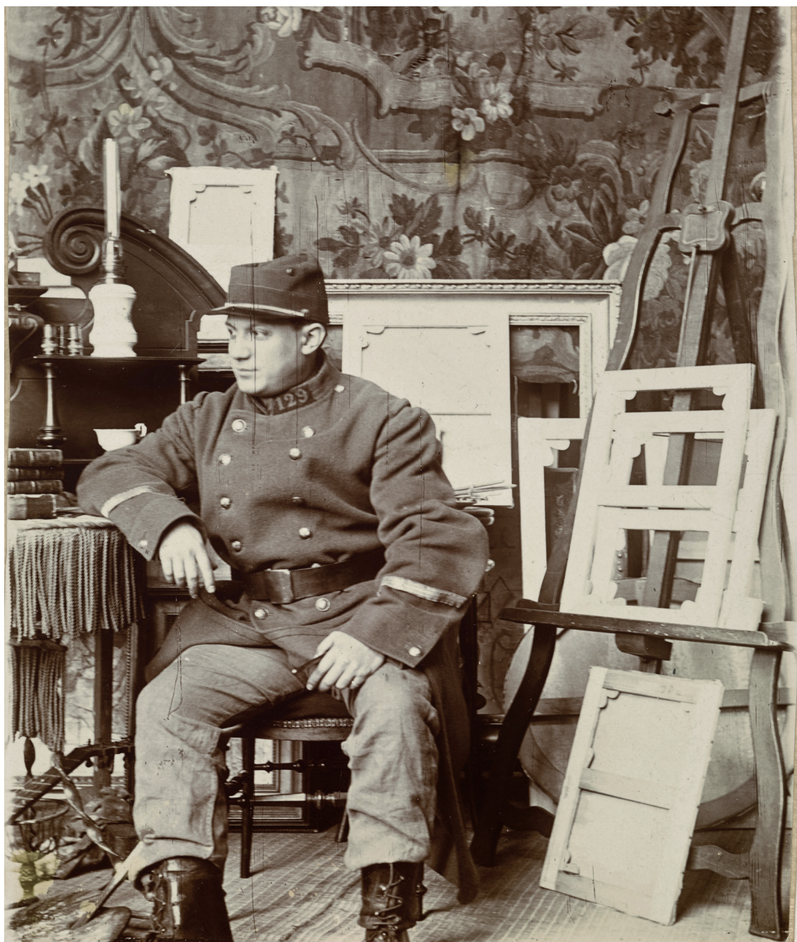
Georges Braque, Portrait de Picasso revêtu de l'uniforme militaire de Braque dans l'atelier du 11 boulevard de Clichy, Paris , photographie © Musée national Picasso-Paris © Adagp, Paris, 2018