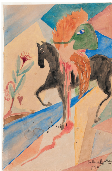
Apollinaire, Autoportrait en cavalier masqué décapité , 1916

Le musée national Picasso-Paris est le principal contributeur de cet événement avec la mise à disposition de plus de 200 œuvres et documents issus de son fonds. L'exposition compte un nombre important de prêts provenant d'institutions aux fonds historiques et artistiques : le musée national d'art moderne - Centre Pompidou, le musée de la Résistance nationale de Champigny-sur-Marne, les archives de la préfecture de Police, le musée d'art et d'histoire de Saint-Denis, le musée de la Grande Guerre de Meaux, les archives de l'UNESCO, le musée d'art moderne-donation Maurice Jardot de Belfort, le musée des Beaux-Arts d'Orléans, les archives départementales de Haute-Vienne ou encore le musée de Grenoble. D'illustres prêteurs étrangers accompagnent le projet avec des prêts inestimables tels que le musée Picasso de Barcelone, le musée Reina Sofia de Madrid ou encore la National Gallery of Ireland.