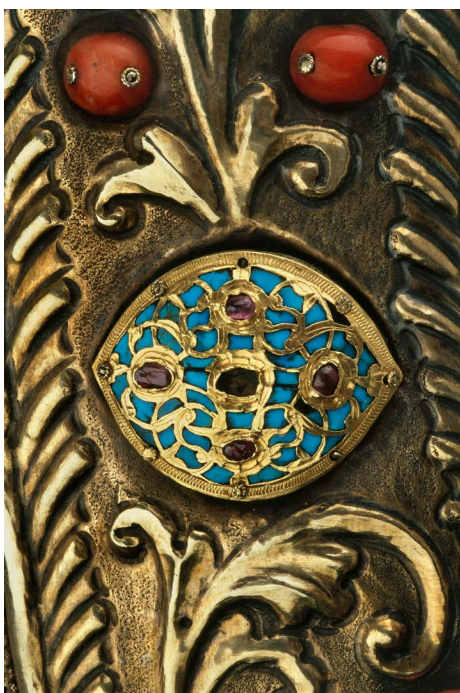
Harnachement de Mamelouk recueilli sur le champ de bataille des Pyramides