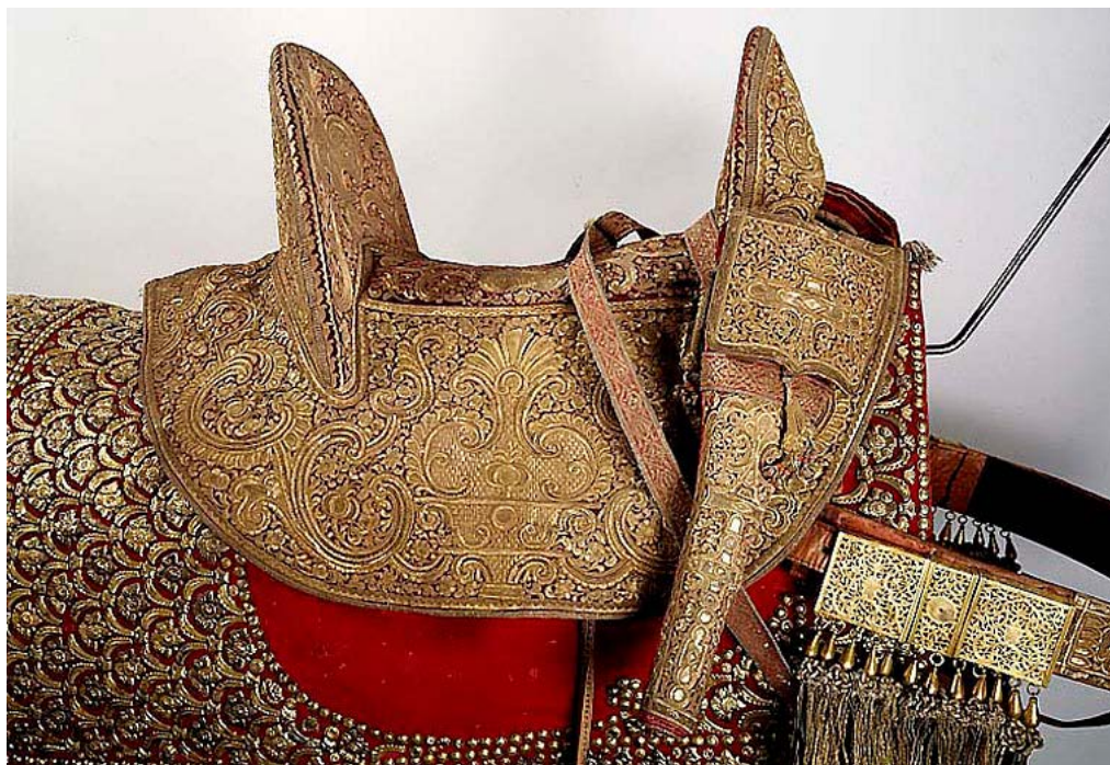
Harnachement de Mamelouk recueilli sur le champ de bataille des Pyramides

La pièce suivante évoque l'une des victoires les plus célèbres du général Bonaparte.