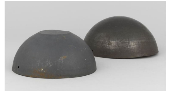
Cervelières. 07-526798