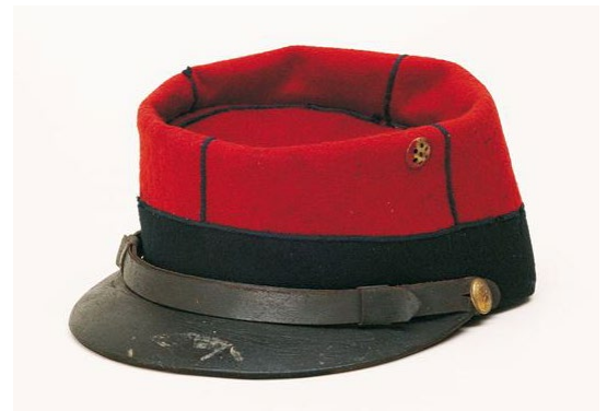
Képi modèle 1884. 07-511252

Après la Première Guerre mondiale, une nouvelle version, plus solide, de couleur kaki, et plus simple à fabriquer, est réalisée en 1926. Ce modèle est utilisé durant la Seconde Guerre mondiale, puis jusqu'aux années 1950 au sein de l'armée française. Les policiers continuent à le porter jusque dans les années 1970. De leur côté les pompiers ont un modèle chromé (= argent brillant) qui les protège en opération jusqu'aux années 1980. Une sacrée longévité, non ?