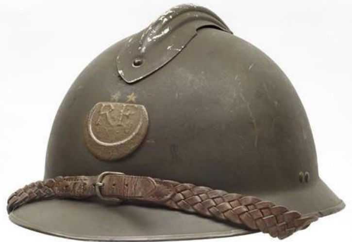
Casque de Chapouilly.

J'ai protégé la tête des soldats français durant la Première et la Seconde Guerres mondiales. Certains corps de métiers, comme les pompiers, m'ont également eu sur la tête jusque dans les années 1980. Pas mal pour une prétendue antiquité !