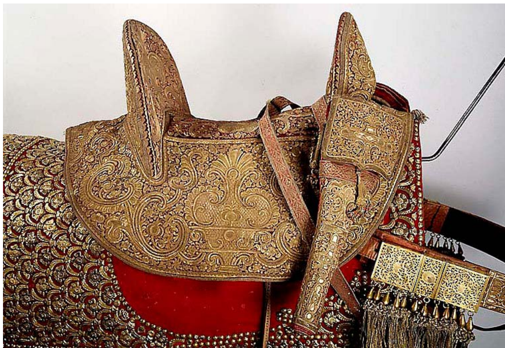
Harnachement de Mamelouk recueilli sur le champ de bataille des Pyramides

La pièce suivante évoque l'une des victoires les plus célèbres du général Bonaparte.