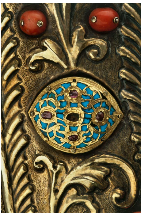
Harnachement de Mamelouk recueilli sur le champ de bataille des Pyramides