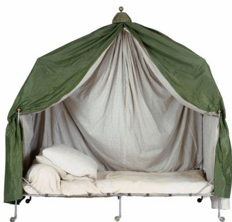
Lit de campagne dont se servait Napoléon Ier à Sainte-Hélène, dit "lit Tayer"

Pièce emblématique, est aussi exposée la table de billard, qui arriva au début du mois de juillet 1816 et où Napoléon I er étalait les cartes dont il avait besoin pour dicter le récit de ses campagnes à ses compagnons d'infortune.