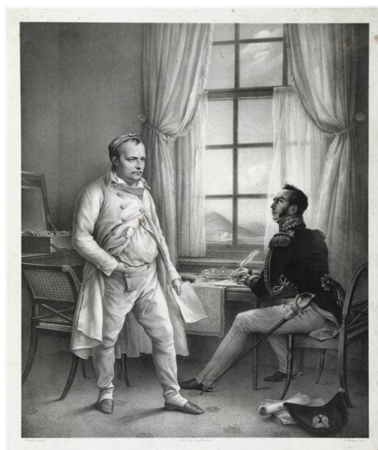
Charles Steuben, L'Empereur à Sainte-Hélène dictant ses mémoires au général Gourgaud